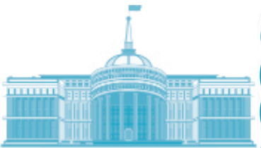
Президент реформасы – өміршең өзгерістер

Осы жылдың 22 маусымында Түркістан қаласында өткен Ұлттық құрылтайдың екінші жиынында Президент Қасым-Жомарт Тоқаев: